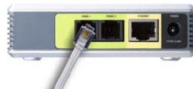
Připojení tel. přístroje

Pro další informace o konfiguraci nahlédněte do “Kapitola 5. Konfigurace nastavení adaptéru”