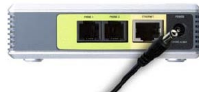
Připojení k napájení