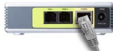
Připojení k síti ethernet